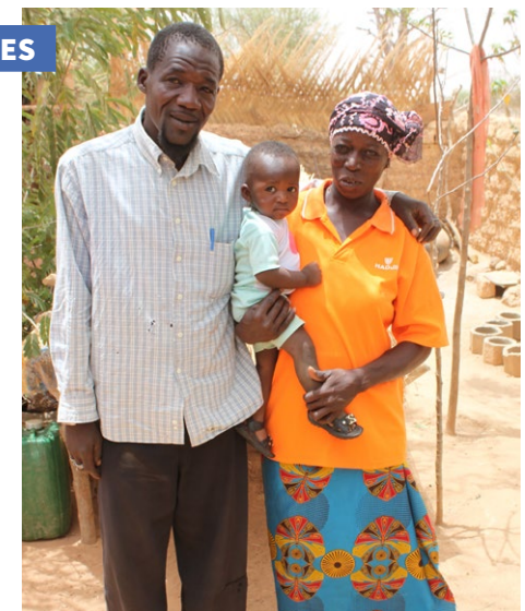
Couple ayant bénéficié des séances d'éducation à la santé, Burkina Faso.