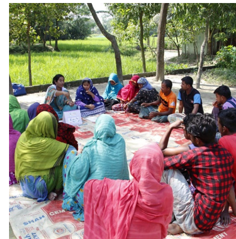
Séance d'éducation à la santé dans un village, Bangladesh.

Dans les écoles, nous formons des enseignant-es et développons des activités ludiques et éducatives pour transmettre aux enfants et à leurs parents les principes d'une alimentation saine et nutritive basée sur les produits locaux, afin de prévenir la malnutrition et favoriser la résilience.