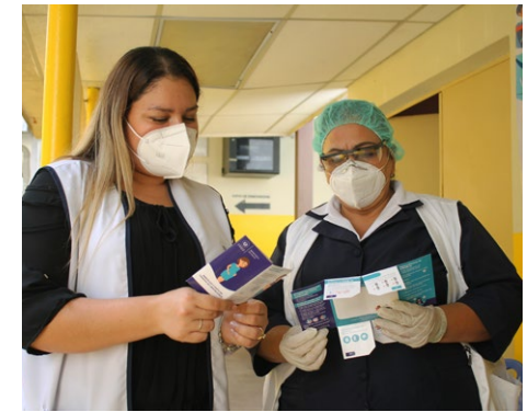
Soignantes consultant les brochures Enfants du Monde dans un centre de santé, El Salvador.

Nous mettons en place des formations universitaires pour les personnes qui occupent des postes de direction au sein des ministères de la santé, en collaboration avec